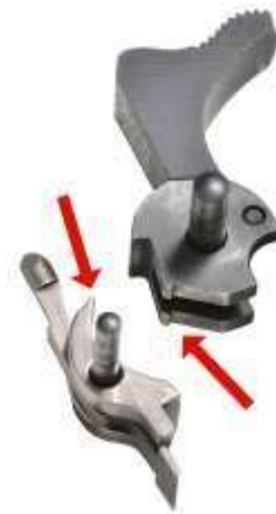
Evidenziati i piani di scatto su cane e controcanne

I congegni di scatto e percussione si avvalgono di molle a spirale o a lamina che forniscono a una "massa battente" (il cane o lo stesso percussore) l'energia necessaria al "percussore", elemento che trasferisce l'urto della massa battente alla capsula della cartuccia. È presente un "arpionismo" che fissa la molla e il cane in posizione di armamento. Sono presenti inoltre un "dente di arresto" ricavato sulla massa battente e un dente di scatto (i piani di scatto). Il grilletto o leva di scatto di un'arma da fuoco, mette in contatto la leva stessa con il meccanismo di percussione facendolo funzionare in vari modi.