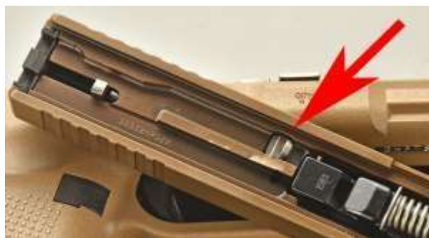
La freccia indica la provvidenziale sicura automatica al percussore collocata all'interno del carrello

Le sicure automatiche sono, invece, quelle sempre attive. Esse si disattivano solo al momento dello sparo volontario dell'utilizzatore.