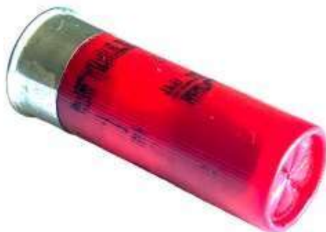
Cartuccia calibro 12. Anteriormente si nota la chiusura "stellare"

In questo caso il calibro indica il numero di palle - di eguale peso - che si possono ricavare da una libbra inglese (gr. 453,6) di piombo. Quindi, un fucile da caccia cal 12, (12 palle) ha un calibro in millimetri più grande del calibro 20 (20 palle).