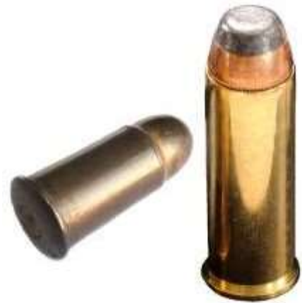
Una cartuccia 10,4mm Ordinanza Italiana e in piedi una .44 Remington Magnum

Da notare poi che un'identica cartuccia può prendere vari nomi in base al paese che l'adotta. Il noto calibro 9x19, è denominato anche: 9 Luger , 9 Parabellum , 9 lungo Beretta M38 , 9 lungo , 9 M38 , 9 mm Pistolen-Patrone 08 , 9 mm Pistolen-Patrone 400(b) , 9 mm Pistolen-Patrone M 1941 , 9 mm Suomi , 9 mm Swedish m/34 e m/39 , 9 mm 40 M Parabellum .