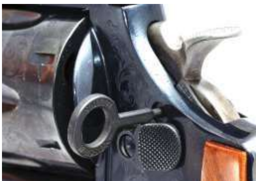
Sicura a chiave di un revolver

Sempre nell'ambito dei revolver, esistono anche particolari sicure manuali, che si attivano tramite piccole chiavi che impediscono l'utilizzo delle armi a persone non autorizzate.