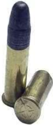
Cartucce calibro .22LR, notare l'impronta del percussore sul bordo del fondello

Al momento dell'esplosione si raggiungono temperature che variano tra i 1500 e i 2200 gradi centigradi.