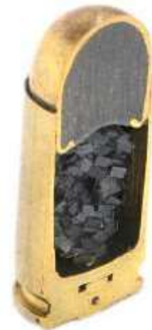
Una cartuccia metallica sezionata. Si nota all'interno la polvere da sparo e la palla blindata con il nucleo di piombo

La capsula, inserita nell'alloggiamento ricavato nel fondello del bossolo, è simile a una coppetta al cui interno è posta una piccola incudine. Nel fondo della capsula è applicata una miscela detonante sensibile agli urti. Quando la capsula è colpita dal percussore, la miscela reagisce, generando la fiamma di accensione che, attraversando il foro di vampa , va a incendiare la polvere da sparo. Per le miscele detonanti dei moderni inneschi si utilizza: stufnato di piombo, solfuro di antimonio, nitrato di bario, tetrazene.