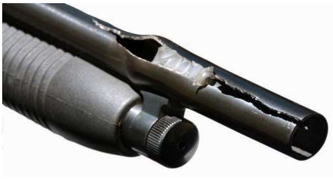
Fucile calibro 12. Il picco delle pressioni, dovuto a ostruzione, ha causato rigonfiamento e fessurazione della canna in prossimità della volata

Le alte pressioni, generate dalle moderne cartucce, non si adattano ad armi antiche o mal conservate. Identica attenzione va riposta nel controllo dell'interno delle canne in quanto anche una lieve ostruzione (foglie, sporcizia, pezzuole utilizzate per pulizia) può provocare danni molto gravi, sia al tiratore, sia a persone a lui vicine.