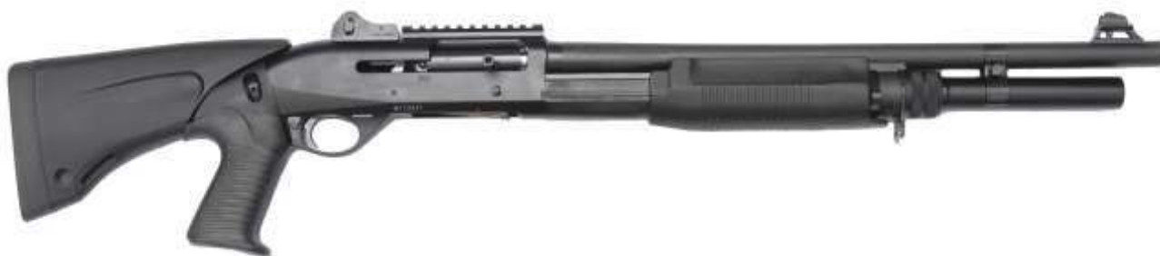
Un moderno fucile semiautomatico calibro 12 in configurazione tattica

In ultimo i fucili semiautomatici , che impiegano vari sistemi di funzionamento. I modelli più diffusi si avvalgono di otturatori a testine rotanti, sistemi a recupero di gas e principi inerziali.