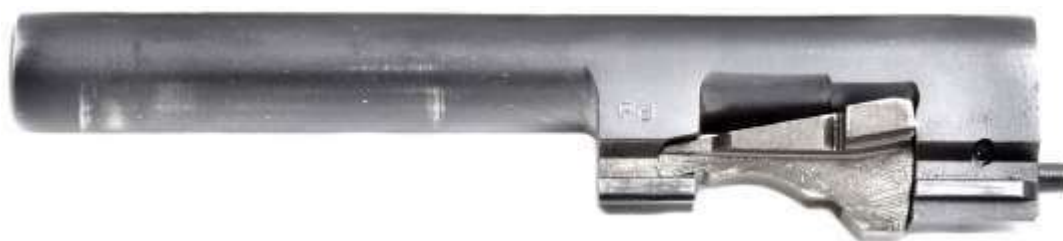
La canna di una pistola Beretta serie 92/98 dotata di blocchetto oscillante. Il sistema Walther prevede che la canna possa solamente arretrare sul suo asse, lasciando al blocchetto il compito di oscillare verso il basso

Tale sistema si avvale di un blocchetto oscillante, posto sotto la canna, che durante lo sparo consente di mantenere l'accoppiamento canna - carrello nei primi millimetri di arretramento, dopodiché, mentre la canna si blocca restando in asse, il blocchetto si abbassa e permette al carrello di svincolarsi e continuare la sua corsa retrograda.