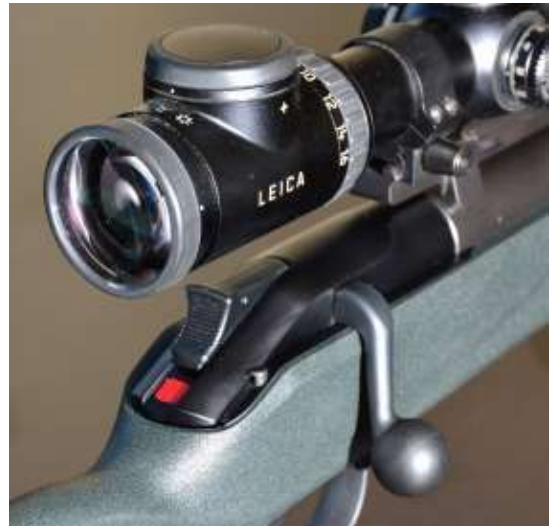
Una carabina dotata di pulsante disarmo del percussore. Un vistoso elemento rosso avvisa che il percussore è armato

Di seguito alcuni “ concetti di sicurezza ” che riguardano sia la gittata delle cartucce a palla, sia la particolare meccanica delle armi lunghe impiegate in ambito venatorio.