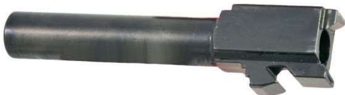
L' asola a piani inclinati, ricavata nello zoccolo e la parte posteriore della canna a profilo prismatico di una pistola Glock che adotta la chiusura Colt/Browning modificata

Nei sistemi Colt/Browning modificati , è stata eliminata la sopracitata biella. In alcuni modelli sono ancora presenti i tenoni della canna (come nel progetto primario) mentre, in sostituzione della biella, è stata ricavata un'asola a forma di L nella quale scorre un traversino che, durante il ciclo di sparo, provvede a guidare verso il basso la parte posteriore della canna stessa. Altri modelli presentano nello zoccolo un'asola a piani inclinati che scorre su un elemento fulcrato al fusto. La chiusura iniziale si avvale generalmente della parte posteriore della canna, caratterizzata da profilo prismatico, che si adatta nella finestra d'apertura del carrello.