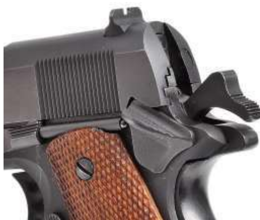
Una pistola Colt mod. 1911 con sicura inserita e cane armato. Il grilletto è bloccato, l'arma è "cocked and locked"