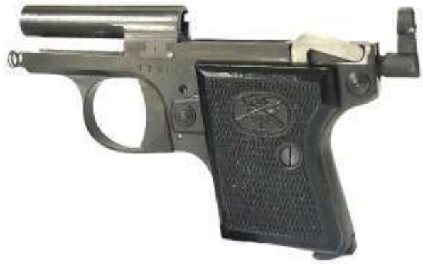
La pistola Bernardelli, mod. Baby, dotata di chiusura a massa in smontaggio ordinario. Si nota la canna ancorata al fusto

Il sistema di chiusura Colt/Browning a corto rinculo di canna si avvale, per il funzionamento, dei tenoni ricavati sulla canna in prossimità della camera di cartuccia. I tenoni combaciano con rispettivi incavi praticati sul cielo del carrello. La canna è provvista di uno zoccolo al quale è fulcrata una piccola biella, a sua volta trattenuta al fusto tramite il traversino della leva arresto carrello (hold open) .