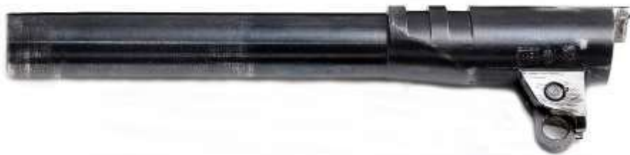
La canna di una pistola Colt mod 1911, dotata di biella e tenoni

Nel sistema Colt , all'atto dello sparo, l'energia cinetica fa arretrare, per pochi millimetri, canna e carrello otturatore che rimangono accoppiati mediante i tenoni della canna e gli intagli ricavati nel cielo del carrello.