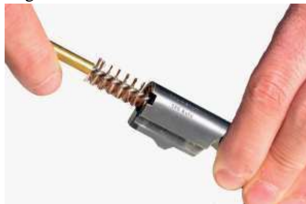
Lo scovolo dovrebbe essere inserito dalla camera di cartuccia

Prima dello smontaggio ordinario, si deve effettuare la sequenza di accertamento dello stato dell'arma (vedi sequenza su parte 1 a del manuale); in seguito si provvederà a rimuovere i residui dello sparo con appositi spazzolini e sgrassare le parti interne utilizzando un solvente generico. L'interno della canna dovrà essere pulito, con energiche e ripetute passate, utilizzando uno scovolino in rame o bronzo. Ne esistono di varie lunghezze a seconda della lunghezza della canna. Il revolver necessita della pulizia delle camere del tamburo, specialmente nella parte anteriore dove si depositano i residui della vaporizzazione del materiale di cui sono composte le palle utilizzate.