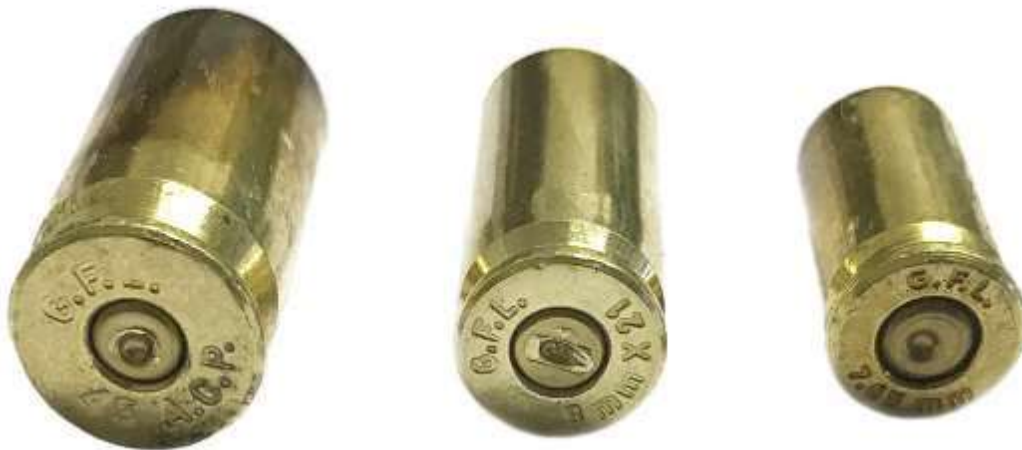
Foto di alcuni bossoli sparati che recano sulla capsula l'impronta del percussore. Si nota nel fondello l'indicazione del calibro e della fabbrica

Inizialmente, per la carica di lancio si utilizzava la cosiddetta “ polvere nera ”, una miscela ternaria di carbone, zolfo e salnitro. Non priva di difetti, la polvere nera a fine anni 800 fu gradualmente sostituita dalla polvere da sparo moderna, detta “ infume ” a causa del minor fumo che genera durante la combustione.