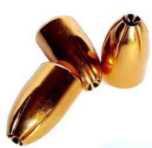
Palle Hexagon calibro 9mm

Prendiamo a esempio il calibro 9mm che forse tutti hanno sentito citare. Se entraste in un'armeria chiedendo di acquistare delle cartucce calibro 9mm, l'armiere resterebbe interdetto e vi chiederebbe di essere più precisi. Perché infatti il calibro da solo non basta a indicare il tipo di cartuccia.