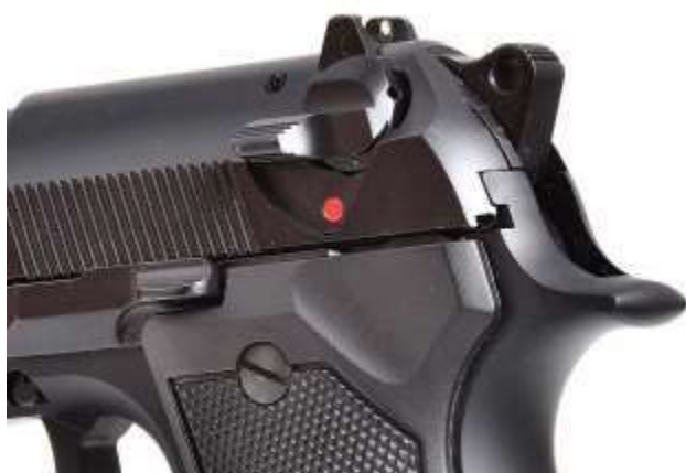
Pistola Beretta serie 92. Si nota la sicura manuale che, oltre ad interrompere la catena di scatto, ha la funzione "abbatticane"

Le sicure manuali si inseriscono tramite leve ergonomiche applicate sulla struttura dell'arma. Quando attivate agiscono sui meccanismi interni in vari modi. Possono interrompere la catena di scatto e/o, in particolari modelli, evitare di azionare manualmente il cane tramite la sicura detta " abbatticane ". Tale congegno provvede a sottrarre il percussore all'azione del cane mentre questo torna in posizione di riposo in piena sicurezza.